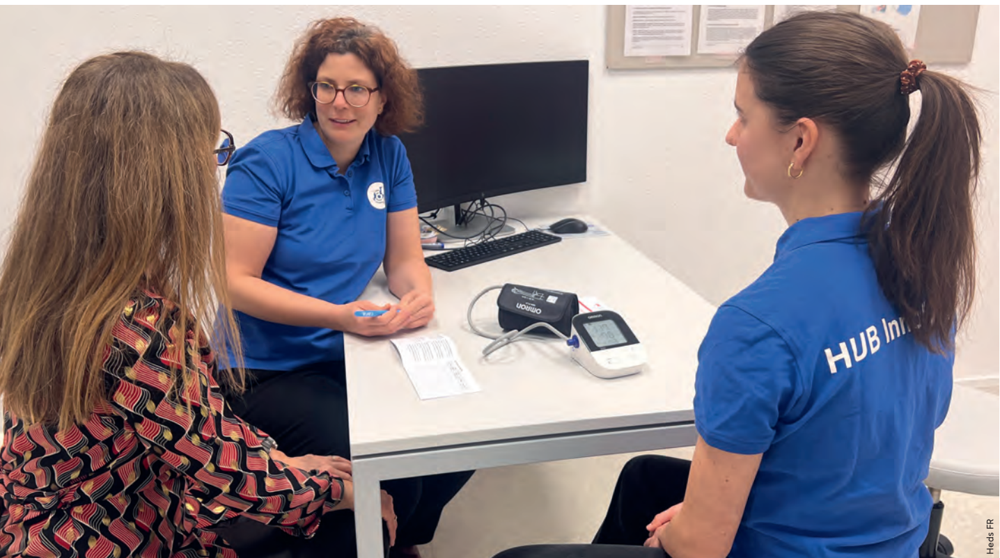
Eine Studierende (rechts), ihre Lehrperson und eine Patientin besprechen im HUB InnoSanté das Selbstmanagement bei Bluthochdruck.